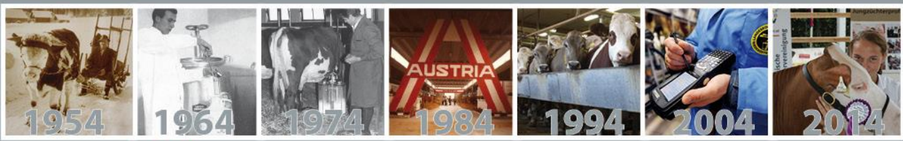
RINDERZUCHT AUSTRIA – 60 Jahre Zentrale Arbeitsgemeinschaft österreichischer Rinderzüchter (1954 - 2014)