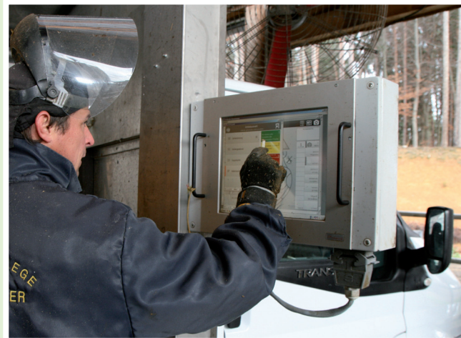
Die Eingabe der Daten von Diagnose und Behandlung erfolgt am besten elektronisch direkt nach der Klauenpflege.